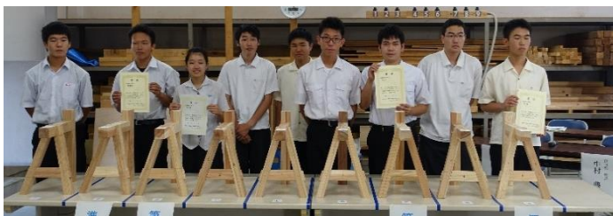
2019年 ものづくりコンテスト東海大会（2名出場 内1名第3位）