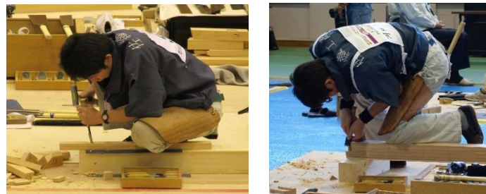
2018年 技能五輪全国大会（2名出場）