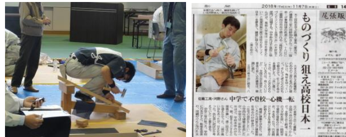
2018年 全国大会（準優勝）