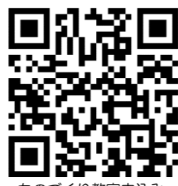
ものづくり教室申込み