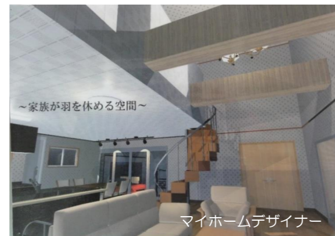
~家族が羽を休める空間~