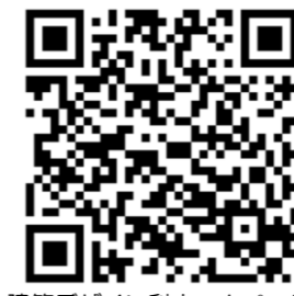
建築デザイン科ホームページ