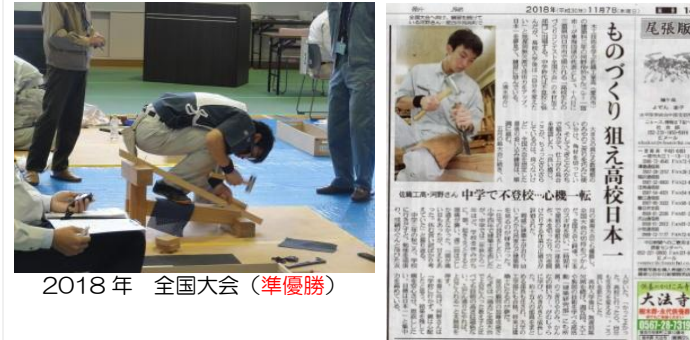
2018年 全国大会（準優勝）