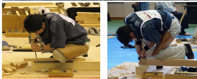
2018年 技能五輪全国大会（2名出場）