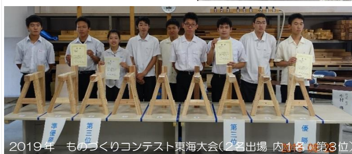
2019年 ものづくりコンテスト東海大会（2名出場 内1名第3位）